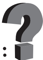
TABLEAU ÉVOLUTIF DE LA CONSTRUCTION IDENTITAIRE