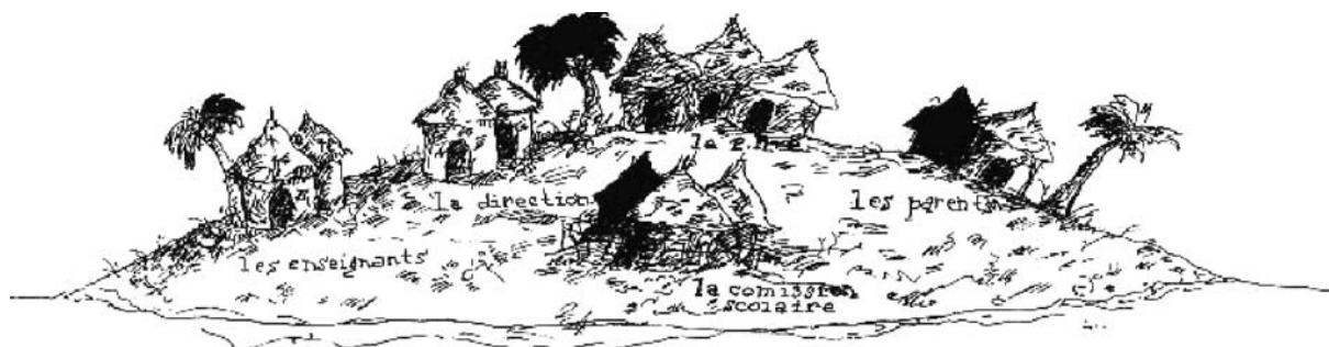
Figure 1 : L'île scolaire

Une des tribus de l'île scolaire est celle des directrices et directeurs d'établissements. C'est une tribu très particulière : ses membres sont issus d'une autre tribu, celle des enseignants. Ils habitent toujours avec ces derniers tout en vivant un peu en ermites. De plus, ils se déplacent régulièrement pour rencontrer la tribu des cadres scolaires, ils organisent des rencontres avec celle des parents et ils discutent fré-