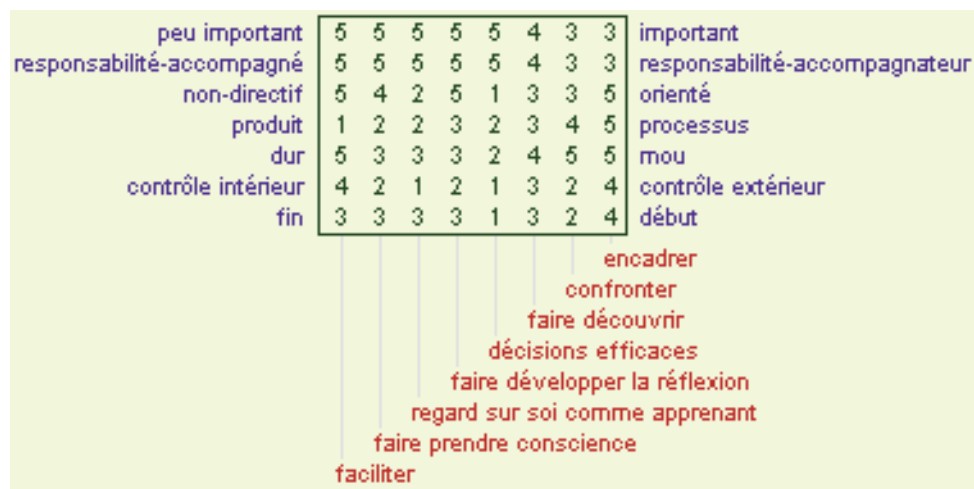
Figure 1. Éléments et construits émergents

Dans la présente analyse, les résultats portant sur une définition collective de l'accompagnement métacognitif sont abordés en deux temps, d'abord ses éléments et ensuite les construits qui caractérisent les éléments. Huit éléments et sept construits ont émergé de la discussion (voir figure 1 ci-dessous).